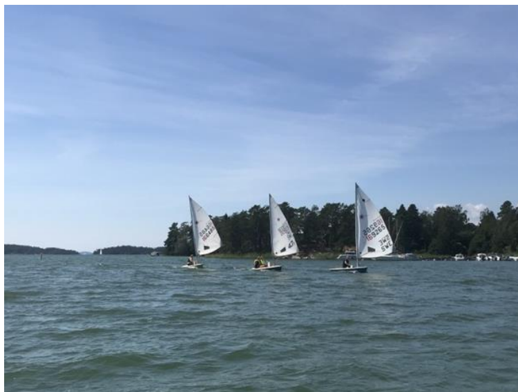
Triss i Lasrar!