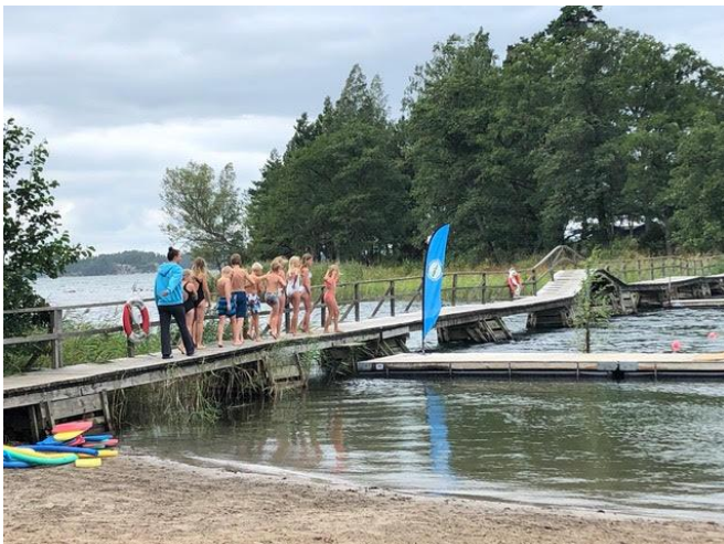
Simskola på gång!