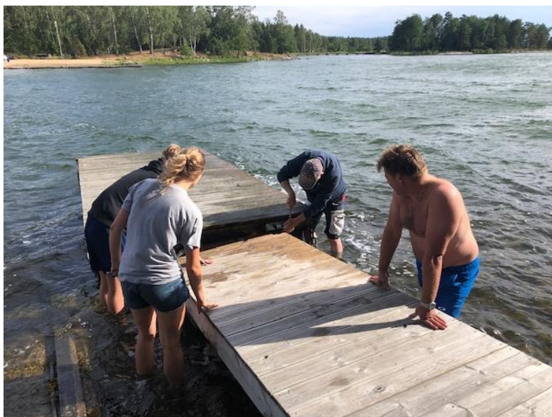
Här lagas jollebryggan med frivilliga krafter, den hade slitit sig våren 2020