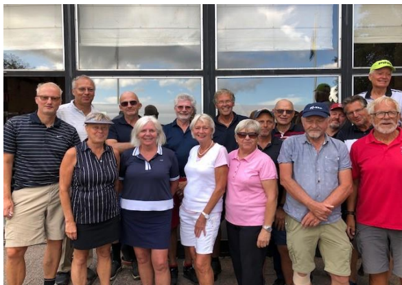
2019 års glada deltagare av Ornö Golf

ORNÖ GOLF spelas 7 augusti på Husby golfklubb. Anmälan sätts upp på MIF huset som vanligt i sommar. Hoppas på en bra anslutning och fint väder. Kul om fler kvinnor anmäler sig. Tård Öiängen, Breviksängen 202 tel. 0708-320444