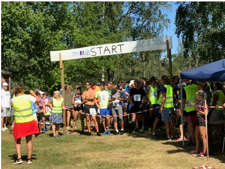
Inför starten på Ornöloppet 2019