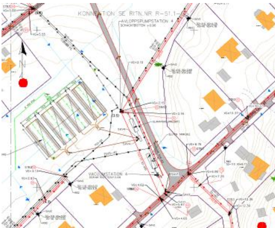
Nuläge med spontning pålning