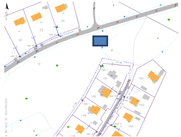
Nya Förslaget av placering tank