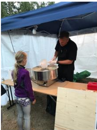
Sockervadd var poppis på MIF-festen!

MIF ansvarar övergripande även för midsommardansen och MIF-festen (en familjefest med 5-kamp och lotter m.m.) som arrangeras av kvarteren i Mörbyfjärdens tomtområde. Det praktiska ansvaret för midsommarfirandet och MIF-festen växlar enligt en fastställd turordning. I år arrangeras midsommarfirandet av Bodal/Bodalsberget och MIF-festen av Norra Gärdet/Norra Storskogen . Varje kvarter representeras av ett kvartersombud vars främsta uppgift är att vara kvarterets kontaktperson mellan kvarteret och styrelsen. Kvartersombuden ska också samordna de boende i kvarteret inför MIF:s olika arrangemang och aktiviteter.